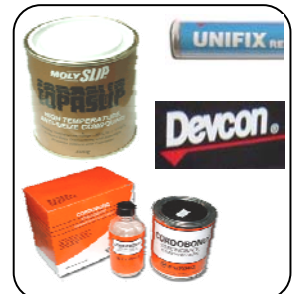
น้ำยา ต่าง ๆ