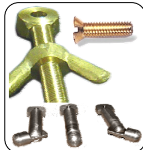
สกรูชนิด