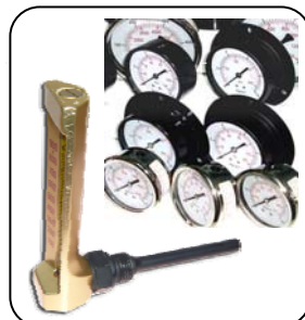
เกจ + เทอร์โม