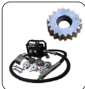
เฟือง เต่าปั่นสนิม