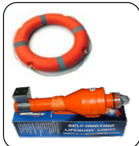
อุปกรณ์เซฟตี้