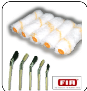
แปรงทาสี / ลูกกลิ้ง