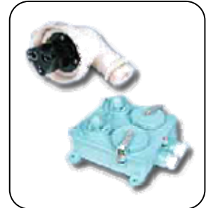
ปลั๊กไฟ - โคมไฟ