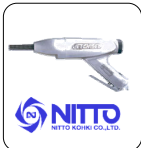
ปืน สเปย์ ยิงสนิม